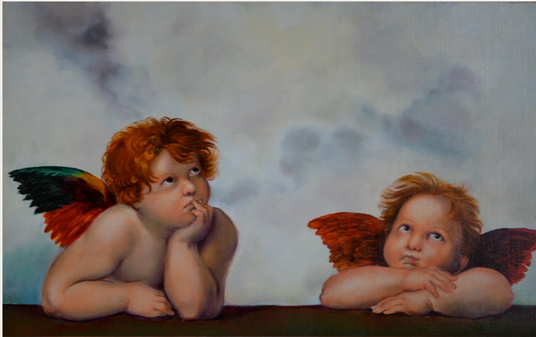
Raphaël, La Madone Sixtine (Détail des putti accoudés)